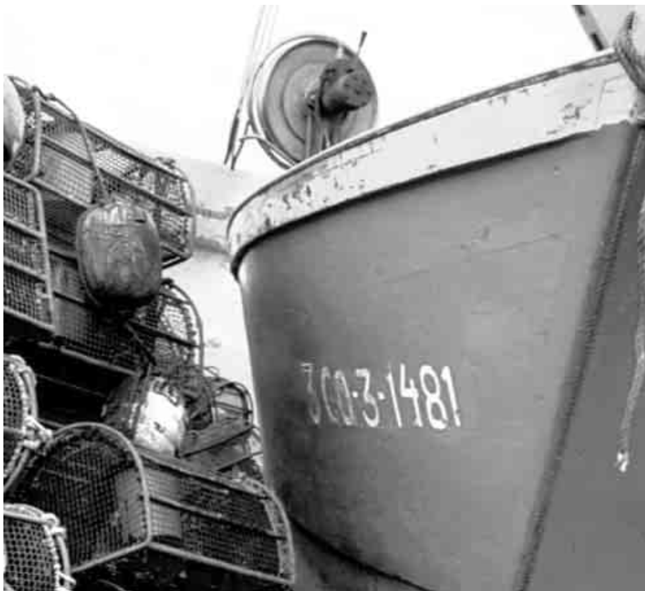
GREENPEACE / PEDRO ARMESTRE

Fuente: Juan Freire, "Impacto del Prestige sobre recursos pesqueros y marisqueros". Ver http://www.udc.es/dep/bave/jfreire/home.htm