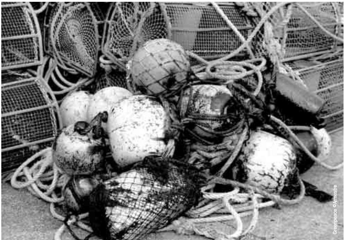
Greenpeace © Armeestre

Un hecho es evidente: un barco de doble casco sin un mantenimiento adecuado o/y sin tripulaciones cualificadas es tan peligroso como un barco monocasco en esas mismas condiciones. La mejora a largo plazo de las condiciones de transporte marítimo solamente se conseguirá con una reforma del régimen que regula la responsabilidad de la industria y las indemnizaciones a las que debe hacer frente en caso de un accidente. En el contexto actual contaminar es simplemente una opción demasiado barata.