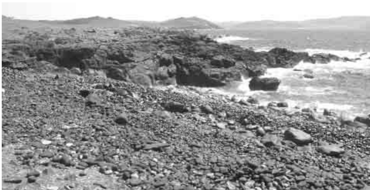
Manchas de fuel fresco el pasado 3 de mayo en Cabo Vilano (Camiñas).

No conviene olvidar que en el informe emitido por el Comité científico sobre la neutralización del pecio del Prestige recomendaba que la extracción de fuel debería poder terminar antes del final del otoño de 2003. También recomendó la articulación de un sistema de seguimiento y control del estado del pecio hasta completar la solución de neutralización definitiva.