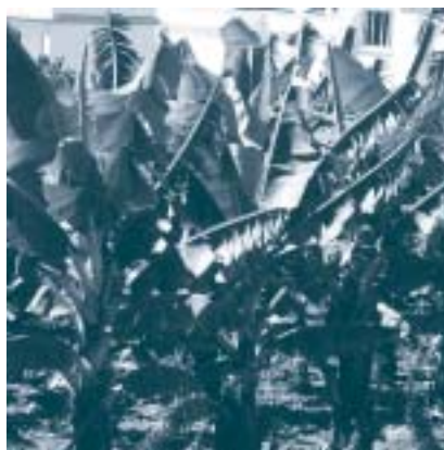
Platanera en la Punta del Hidalgo, La Laguna. (Beatriz Fariñas).

El propio Plan Hidrológico de Tenerife de 1995 no establece la necesidad de depurar los vertidos de los emisa-