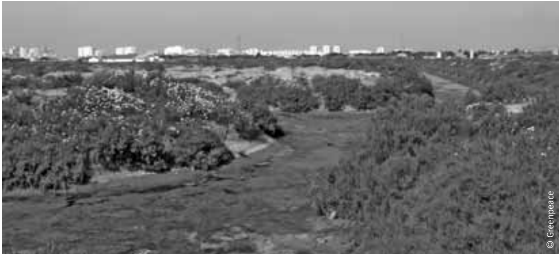
Terrenos desprotegidos por Costas para ubicar un polígono industrial en Las Aletas (Puerto Real, Cádiz).

dentro del Parque Natural). En las escrituras de compra-venta, las sociedades vendedoras, Río Alías y Parque Club El Algarrobico, hicieron constar que las fincas no estaban incluidas en el Parque Natural.