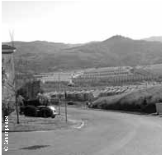
Urbanizaciones cerca de la playa de Getares (Tarifa, Cádiz).

solicitado la declaración de paraje de protección especial por sus valores ambientales, ya que se trata de los últimos reductos de monte mediterráneo de alcornoques que llegan hasta el mar.