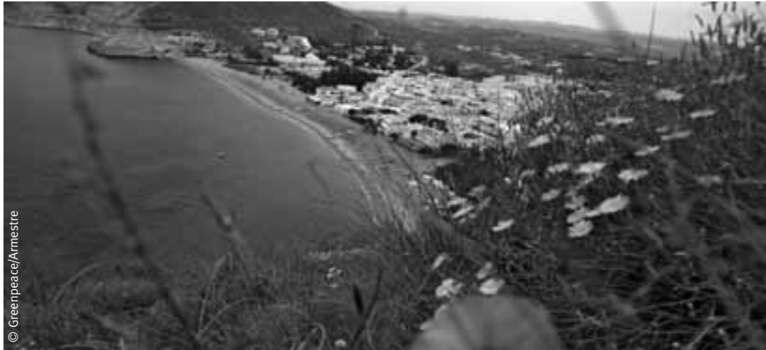
En Aguamarga, 48 hectáreas del Parque Natural Cabo de Gata-Níjar serán destruidas.