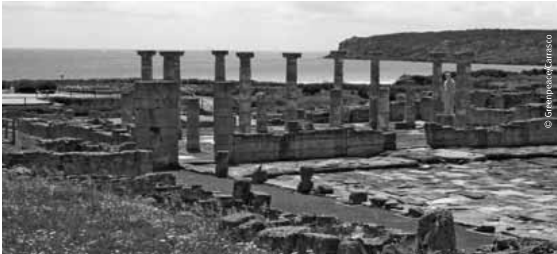
Las ruinas de Baelo Claudia en la playa de Bolonia, Tarifa (Cádiz).

de prevaricación por designar “a dedo” al subinspector de Policía Local, sentencia que ha recurrido.