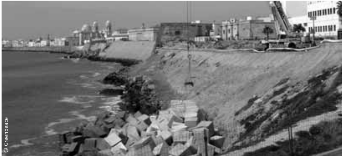
Instalación de bloques de hormigón para combatir la erosión en la costa de Cádiz.

extracción de veinte millones setecientos cincuenta mil metros cúbicos de arena (20.750.000 m 3 ) con el objetivo de regenerar artificialmente 30 playas de esta provincia. Se trata de una enorme cantidad de sedimentos, cuya extracción puede tener consecuencias muy negativas para las playas de Mijas. Los proyectos de dragado de arena suponen una afección negativa significativa donde se desarrollan. Durante la extracción los fondos marinos sufren tanto la succión de la vegetación existente como la turbiedad que genera, responsables de la muerte de hábitats y especies.