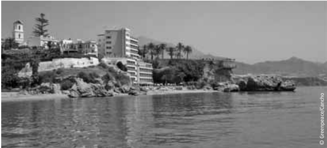
Hotel construido en dominio público en el litoral malagueño.

llegó a las 11.000 por año y de la que la Junta de Andalucía es responsable por dejación de sus funciones de ordenación del territorio. En 2001 el Tribunal de Cuentas declaró al ayuntamiento en quiebra técnica.