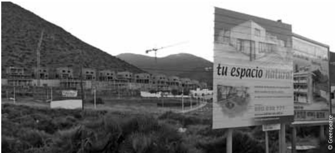
Construcción de viviendas en San José, Almería, en el Parque Natural Cabo de Gata Níjar.

deportivos y la recalificación de 19,7 millones de metros cuadrados.