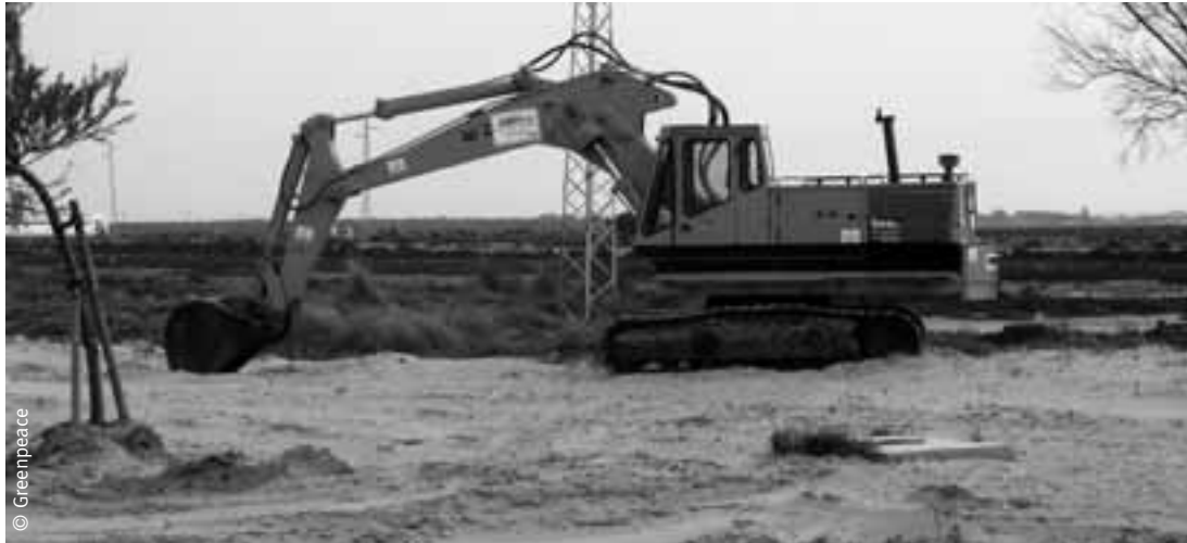
Maquinaria pesada trabajando sobre la arena.

La fiebre por los campos de golf que asola el litoral andaluz no se ve reflejada en las encuestas sobre los gustos de los turistas. Un informe elaborado por el Patronato de Turismo de la Costa del Sol recoge que para el 96,5% de los turistas británicos la Costa del Sol es un destino de ocio y descanso, mientras que tan sólo un 1,4% considera el golf como el principal elemento vacacional, el 2% restante apuesta por los congresos y la motivación cultural.