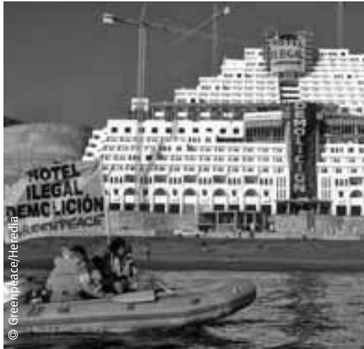
Noviembre de 2005. Acción de Greenpeace contra el hotel ilegal de Azata en la playa de El Algarrobico, Carboneras, dentro del Parque Natural Cabo de Gata-Níjar.

Los municipios de la costa oriental también planean crecer considerablemente. Lújar plantea 2.000 nuevas viviendas enfocadas en su mayoría para el turismo residencial. Rubite incluye 4.000 nuevas viviendas en su nuevo plan urbanístico, destacando una urbanización de 1.500 viviendas con campo de golf, hotel y residencia geriátrica en una extensión de un millón de metros cuadrados. Albuñol incluye 6.000 nuevas viviendas y un campo de golf en sus previsiones.