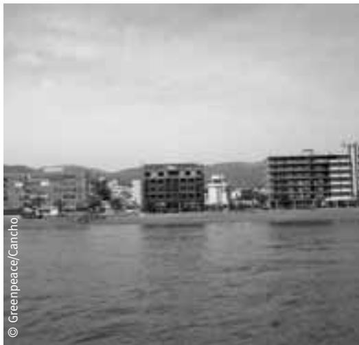
Edificaciones en primera línea de playa en el litoral malagueño.

suelo como urbanas (el 68% del municipio), casi el triple de lo que existe en la actualidad, para construir 15.000 nuevas viviendas.