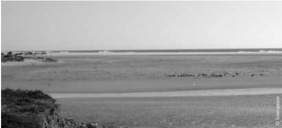
Playas naturales en Conil, Cádiz.