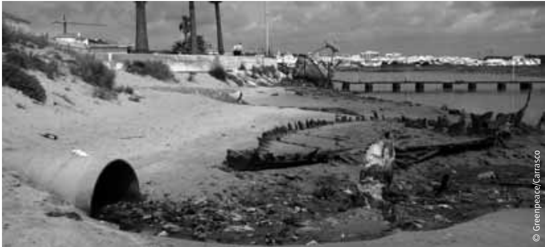
Vertido contaminante en la desembocadura del río Barbate, en Barbate (Cádiz).

no funcionan o, si lo hacen, son claramente insuficientes por lo que siguen arrojando aguas residuales al litoral. De todas las aguas residuales que se vierten al litoral de esta provincia, sólo un 4% son reutilizadas vii .