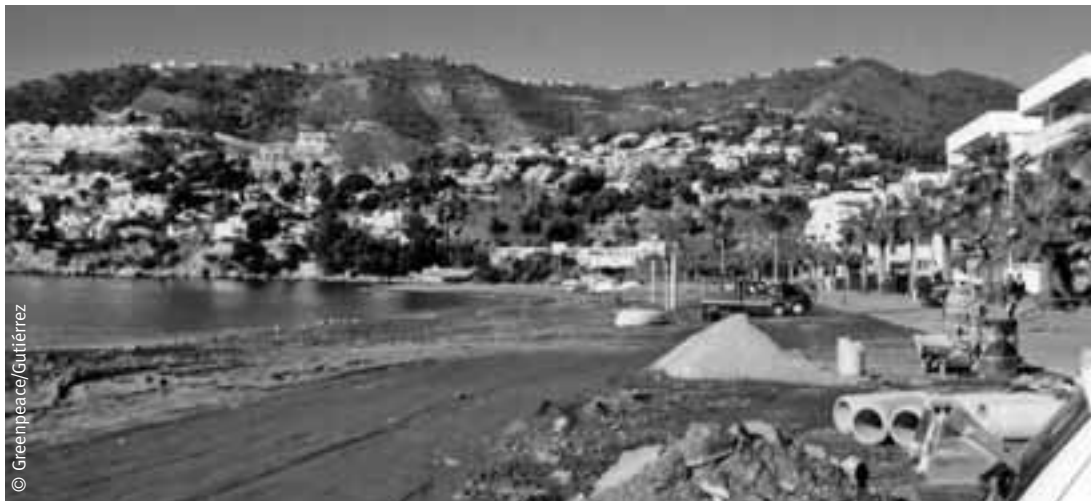
Agresivas obras sobre la playa de La Herradura, Granada.

sus primeras decisiones fue la paralización de las obras del hotel Senator y un edificio de viviendas adjunto, sobre las que pesaba una impugnación de la Junta de Andalucía y una suspensión cautelar por parte del Tribunal Superior de Justicia de Andalucía desde 2004 que no había sido ejecutada por el ayuntamiento. Los terrenos fueron cedidos para equipamiento público, pero el ayuntamiento los vendió por 2,6 millones de euros a la empresa Proinsa quien, a su vez, volvió a venderlos, esta vez por 15 millones, a Hoteles Playa SA , que obtuvo la licencia de obras en tres días. El Tribunal Supremo tiene la decisión final. La gestora ha pedido ayuda a la Junta de Andalucía para afrontar el caos urbanístico de Marbella, calculan que necesitarán al menos tres meses para precintar las obras ilegales y cerca de 6.500 millones de euros para reparar las ilegalidades cometidas. También ha decidido retirar los 700 recursos contenciosos-administrativos que el consistorio había presentado contra las impugnaciones de la Junta de Andalucía respecto a licencias urbanísticas municipales.