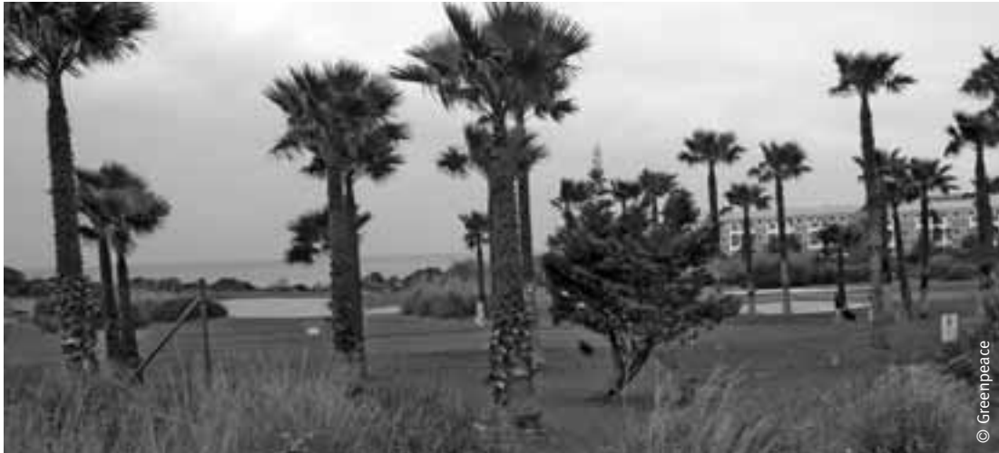
Campo de golf en Chiclana.

próximamente. La modificación sólo puede entenderse como una cesión ante las presiones de los promotores urbanísticos, ya que se limita a variar las disposiciones referentes a este sector, que tendrá la posibilidad de seguir desarrollando grandes operaciones inmobiliarias sin función social alguna.