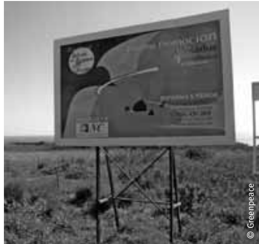
Promociones en el litoral de Conil, Cádiz.

Los informes de los expertos aseguran que la riqueza generada por cada plaza hotelera es de 11.751 euros frente a los 1.456 que produce la oferta residencial en Andalucía. Otro dato a tener en cuenta es que la oferta reglada genera una media de 135 empleos directos frente a los 23 de la oferta residencial.