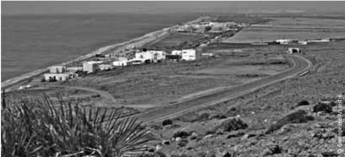
En La Fabriquilla, dentro del PN Cabo de Gata, se ha planeado la construcción de 150 viviendas y un hotel de 40 habitaciones.

tribunales de justicia. En los juicios, la Junta de Andalucía siempre ha presentado unos planos del parque que carecen de validez legal y que nunca han sido publicados oficialmente con el objetivo de dar cobertura a estas actuaciones urbanísticas, que afectan a 200 hectáreas del parque. Ahora, ante la evidencia de la ilegalidad, la Consejería de Medio Ambiente ha propuesto la modificación del PORN, incluyendo todas las reclamaciones de los ayuntamientos para urbanizar espacios protegidos.