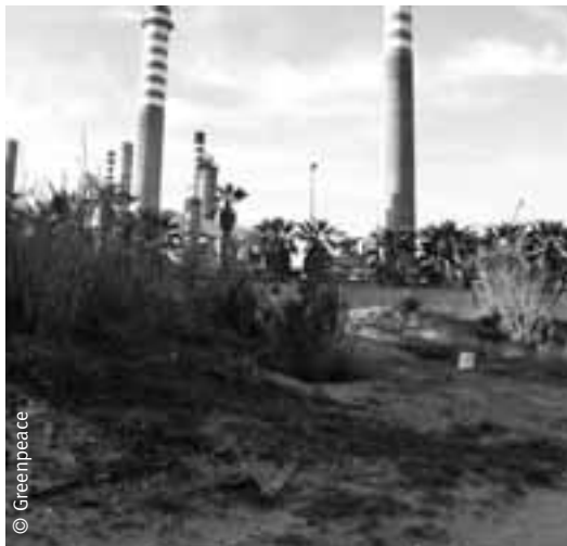
Refinería de San Roque, sobre la misma arena.

determinar que los efectos de los grandes vertidos como el del Prestige (77.000 toneladas) son menores que los detectados en lugares de alta concentración de industrias que arrojan sus residuos al mar de forma continuada. Esta conclusión se extrae al comparar los niveles de contaminación de la costa gallega y la del Campo de Gibraltar, descubriendo que los niveles de toxicidad presentes en la bahía de Algeciras son superiores a los de las zonas afectadas por el Prestige.