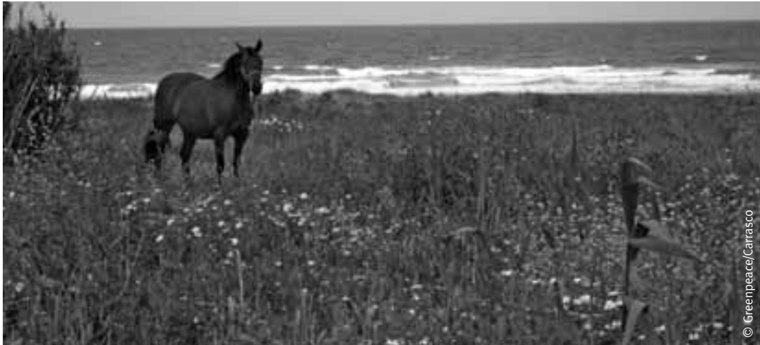
Pradera litoral en Zahara de los Atunes, Cádiz.

A continuación analizamos por provincias la situación de la urbanización y el turismo, siguiendo la línea de costa.