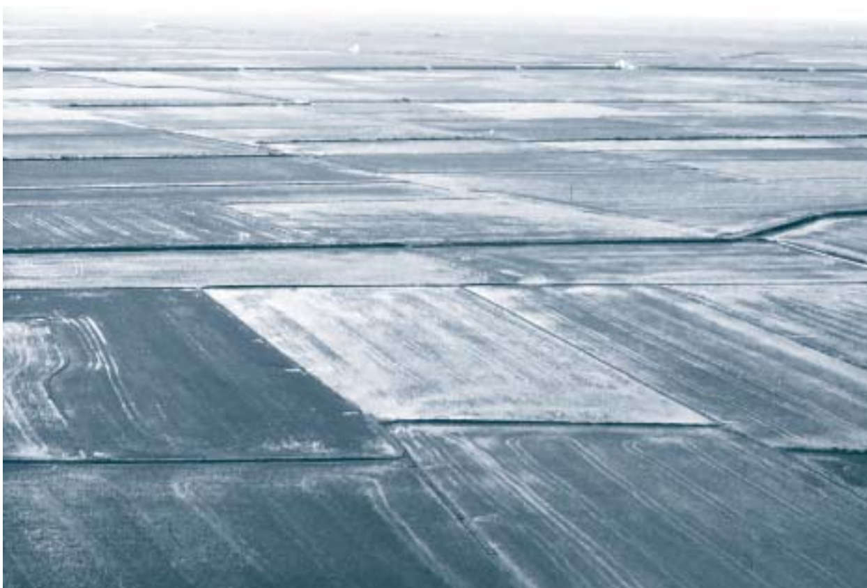
Albufera de Valencia. (Miguel Ángel Soto).