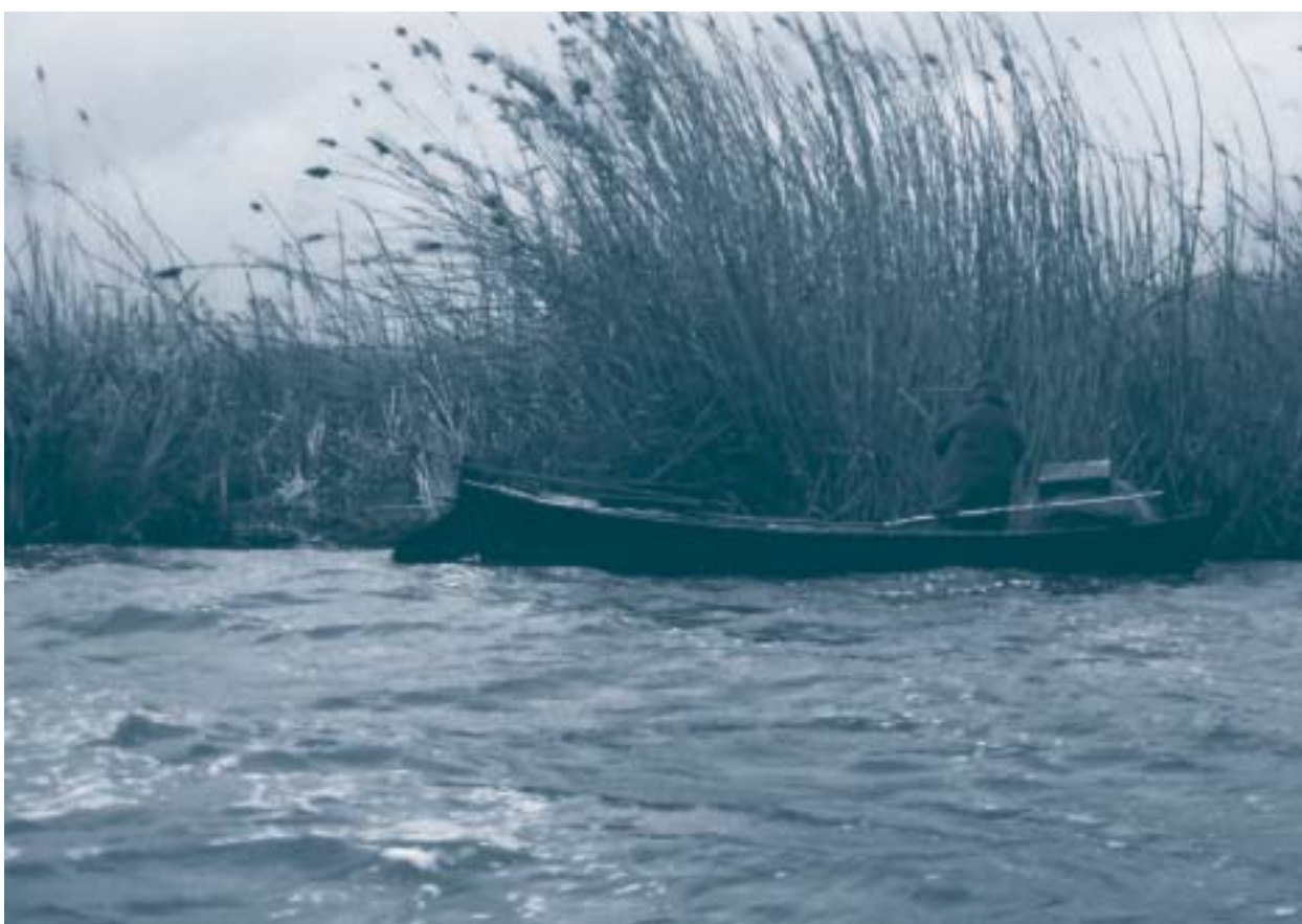
Albufera de Valencia. (Miguel Ángel Soto).

La contaminación difusa por nitratos y fosfatos y los vertidos de aguas industriales y urbanas están produciendo impactos importantes en el medio hídrico. El grado trófico (340) de la cuenca es muy alto (341) . Cinco de sus 27 embalses son eutróficos y otros 6 presentan características hipereutróficas (Tibi, Beniarres, Bellús, Forata, El Regajo y María Cristina).