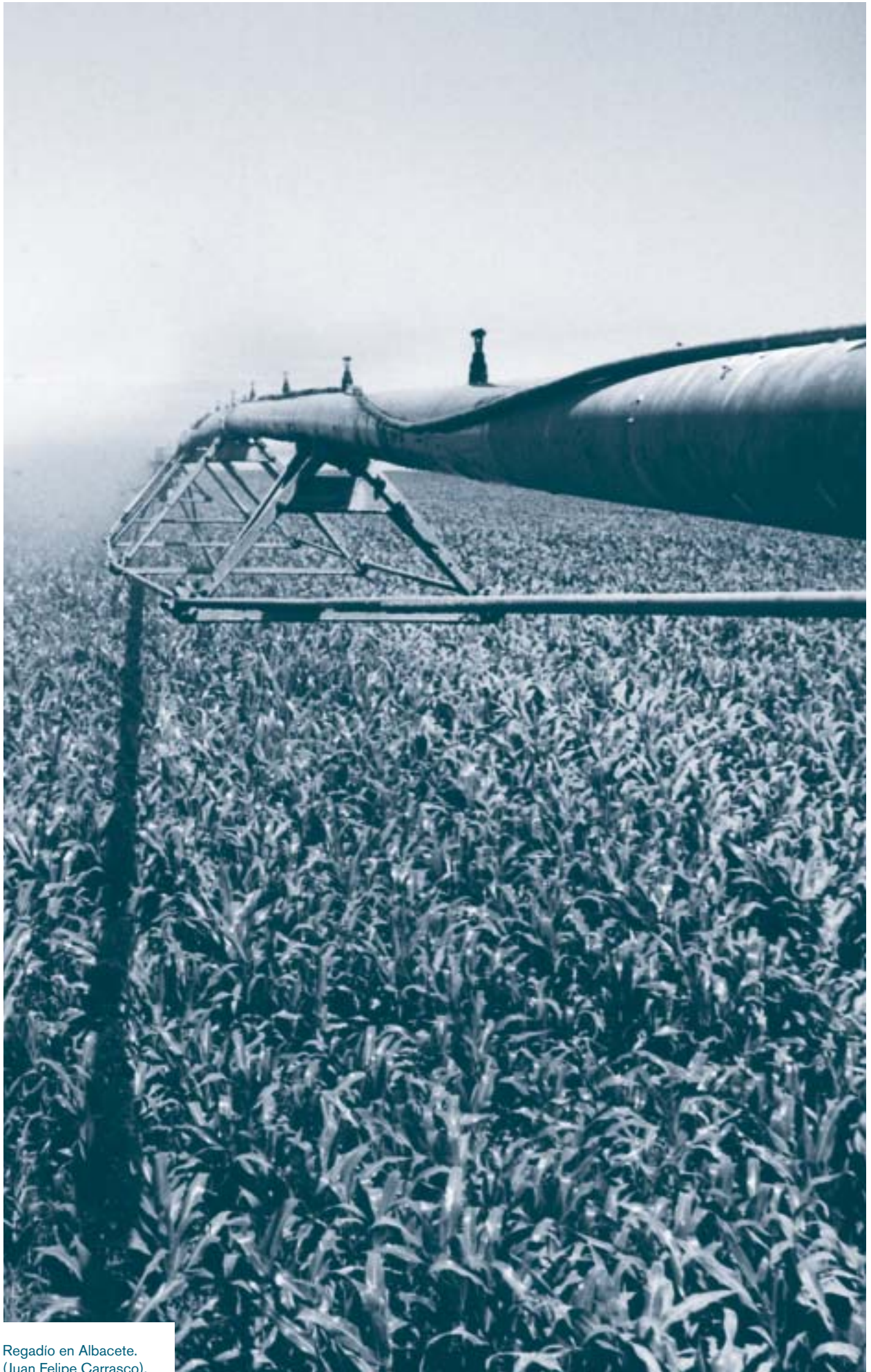
Regadío en Albacete. (Juan Felipe Carrasco).