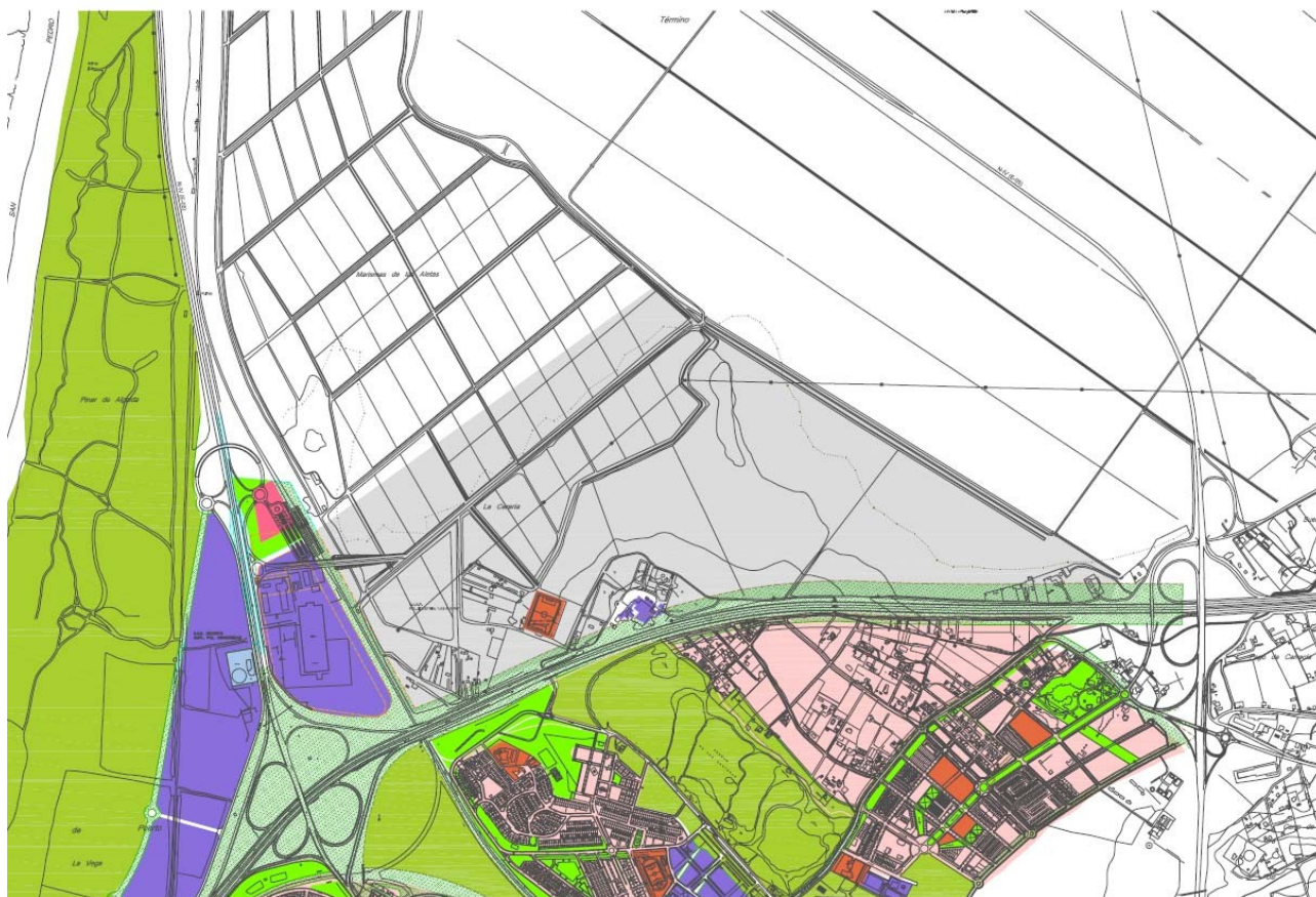
Figura obtenida del plano de ordenación pormenorizada del PGOU vigente. En gris se delimita el Suelo Urbanizable No Programado (No Sectorizado), que ocupa tan sólo una parte de la marisma entre las carreteras CA-32 (antigua N-IV), AP-4 y A-4. Al Norte de ese límite, en blanco, el Suelo No Urbanizable de la marisma.

Si se compara esta figura con la siguiente, se aprecia la ampliación de Suelo Urbanizable que propone el POT.