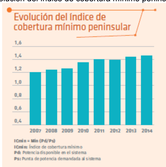
Ilustración .-Evolución del índice de cobertura mínimo peninsular (2007-2014)

Fuente: REE, El Sistema Eléctrico Español , 2014.