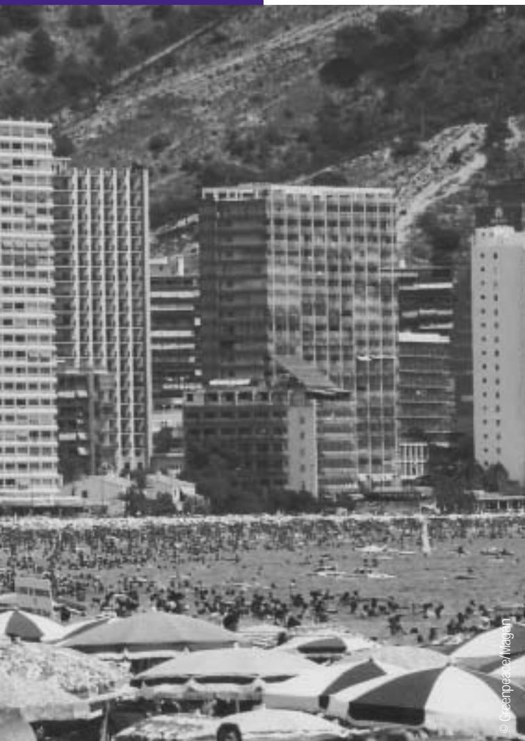
Playa de Benidorm, Alicante.

Según los datos provisionales del Mapa de Usos del Suelo, la Comunidad Valenciana cuenta con 146 km de costa completamente libres de edificación sobre un total de 470. De los primeros, 100 gozan de algún tipo de protección. La Conselleria de Territorio y Vivienda permitirá la urbanización de los 46 restantes. 66 Para ello, el Gobierno valenciano pretende simplificar aún más el trámite de impacto ambiental de las actividades urbanizadoras en la nueva Ley de Ordenación del Territorio y del Suelo no Urbanizable de la Comunidad Valenciana (LOT) recién aprobada. La Ley permite construir a 300 metros de la costa, mientras que la anterior exigía 500. La nueva normativa no excluye la edificación en zonas inundables, sólo indica que la edificación tendrá que dirigirse "hacia las áreas de menor riesgo". 67 La LOT introduce una "ecotasa" para aquellos planeamientos urbanísticos municipales que superen los umbrales establecidos. Los ayuntamientos deberán pagar una cantidad que se dedicará a programas y proyectos ambientales. 68