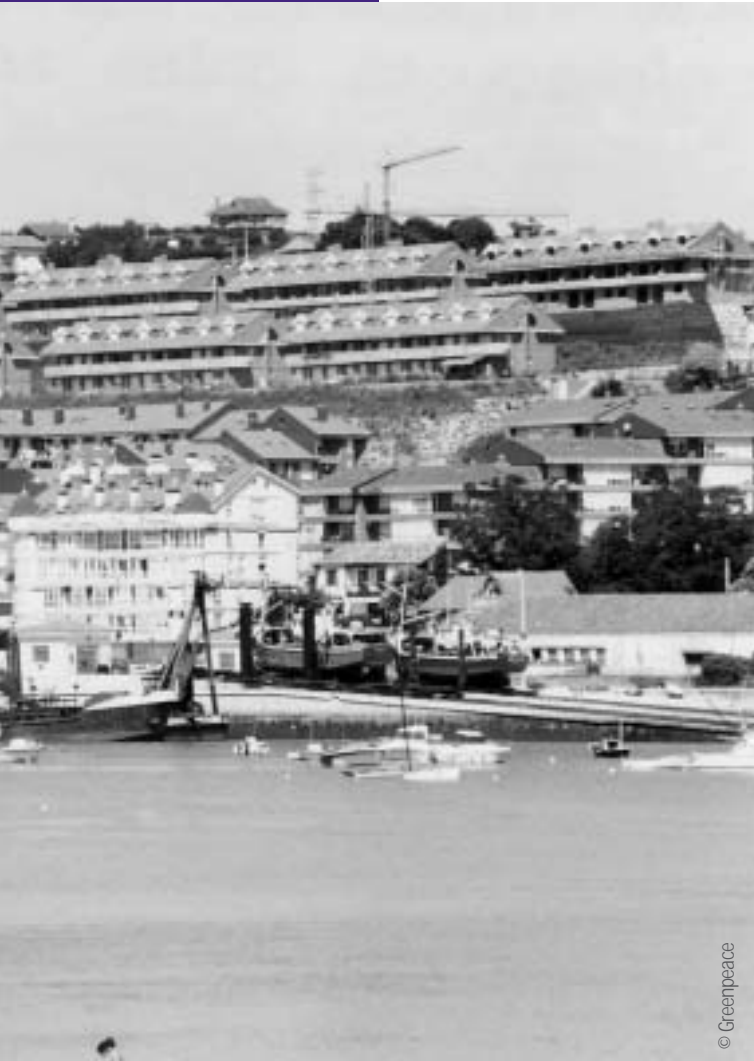
Urbanizaciones en San Vicente de la Barquera.

El Plan de Ordenación del Litoral (POL) es un plan urbanístico y de infraestructuras, que olvida en gran medida la componente ambiental. El plan llega tarde, ya que desde que entró en vigor la Ley de Costas hace más de quince años, se ha permitido una política de ocupación de la costa. En ese mismo tiempo, desde la Dirección General de Costas, tan sólo se han practicado 4 deslinde del dominio público marítimo-terrestre. Esta ausencia de actuación en la delimitación costera ha permitido a los ayuntamientos desarrollar una política de ocupación y hechos consumados olvidándose de los valores naturales y el desarrollo sostenible.