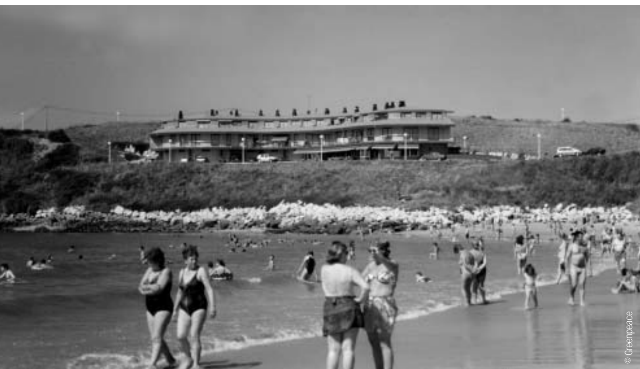
Restaurante en el borde costero. Suances.

La instalación planeada para Castro Urdiales no es nueva. El primer proyecto se presentó en el año 2000. Por aquel entonces, el proyecto carecía de la necesaria evaluación de los impactos ambientales causados por dicha instalación. El presentado ahora goza del visto bueno de la Consejería de Medio Ambiente, a pesar de que supondrá un estrechamiento de la bocana de la ría a una quinta parte, impidiendo la necesaria renovación